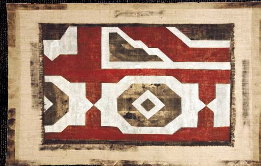
"Oriental Rug" (t.m.j.) 190x140