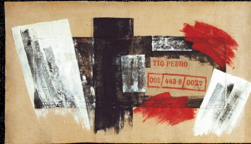
"Astratto Orizzontale (Tio Pedro)" (t.m.j.) 180x100

Dal 1997 ha esposto in mostre personali e collettive a Roma, Napoli, Viterbo, Civita di Bagnoregio, Calcata, Bracciano, Cerveteri, Spoleto, Tuscania, Tivoli, Isola d'Elba.