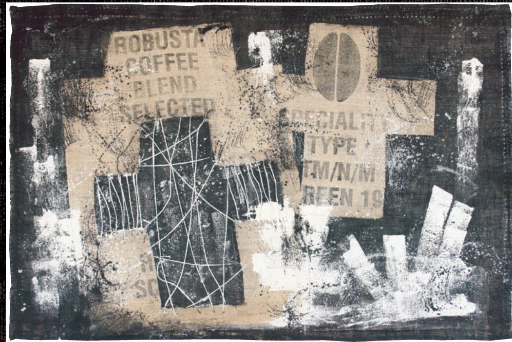
"Astratto Special Type" tecnica mista su sacco - 140x100

PAOLA CORDISCHI 340.8750060 www.paolacordischi.it